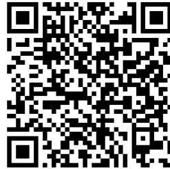
World Relief List