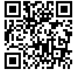
Welcome to IL